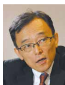
宇川 義一 教授